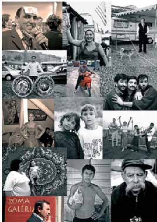
Ausschnitt aus dem Ausstellungs-Flyer.