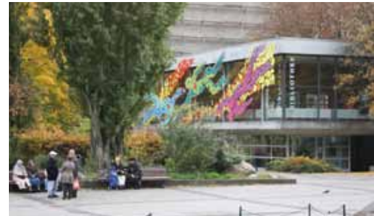
Glasfassade der Schiller-Bibliothek

Die Arbeit Fabregats besteht ausschließlich aus wiederverwertbaren polymerischen Materialien,