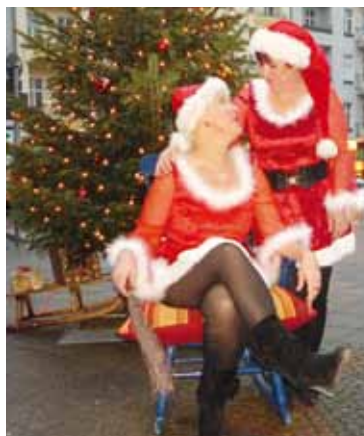
Weihnachtsbaum und Weihnachtsfrauen vor dem Laden