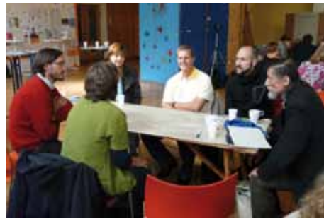
Erfolgreiche Ideenschmiede: Das brachte die Gebietskonferenz