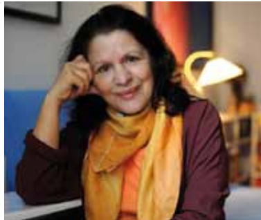
„Roma-Horizonte - Empowerment für Roma-Familien“