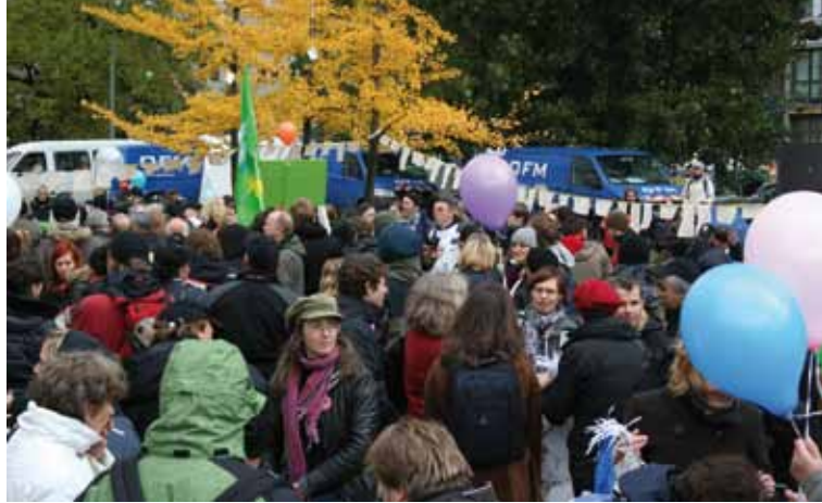
Demonstranten zeigen ihren Ärger gegenüber dem Sozialabbau

Als Minister Peter Ramsauer (CDU) im Juni