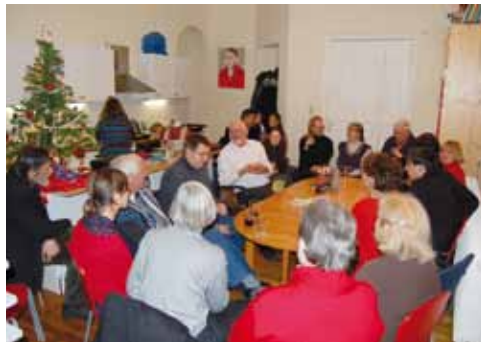
Der lebendige Adventskalender