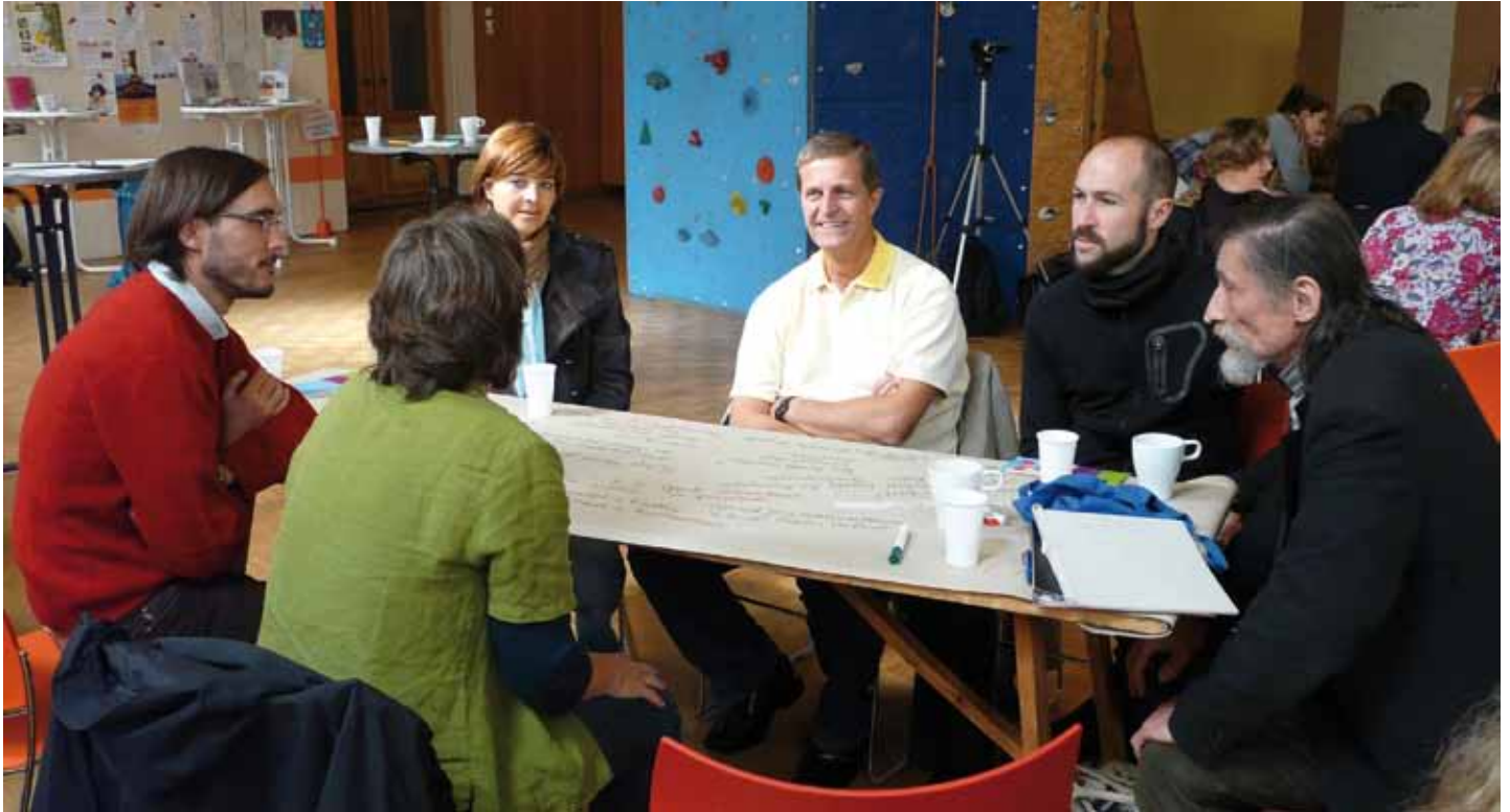
Gute Arbeitsatmosphäre und brauchbare Ergebnisse.

Am Samstag, dem 18.9.2010 fand die Gebietskonferenz des Quartiersmanagements Sparrplatz statt. Rund vierzig Aktive trafen sich in den Räumen der Baptistengemeinde Wedding an der Müllerstraße, darunter neben den Anwohner/innen auch Mitarbeiter/innen des Bezirksamtes, Quartiersräte und Vertreter/innen lokaler Einrichtungen.