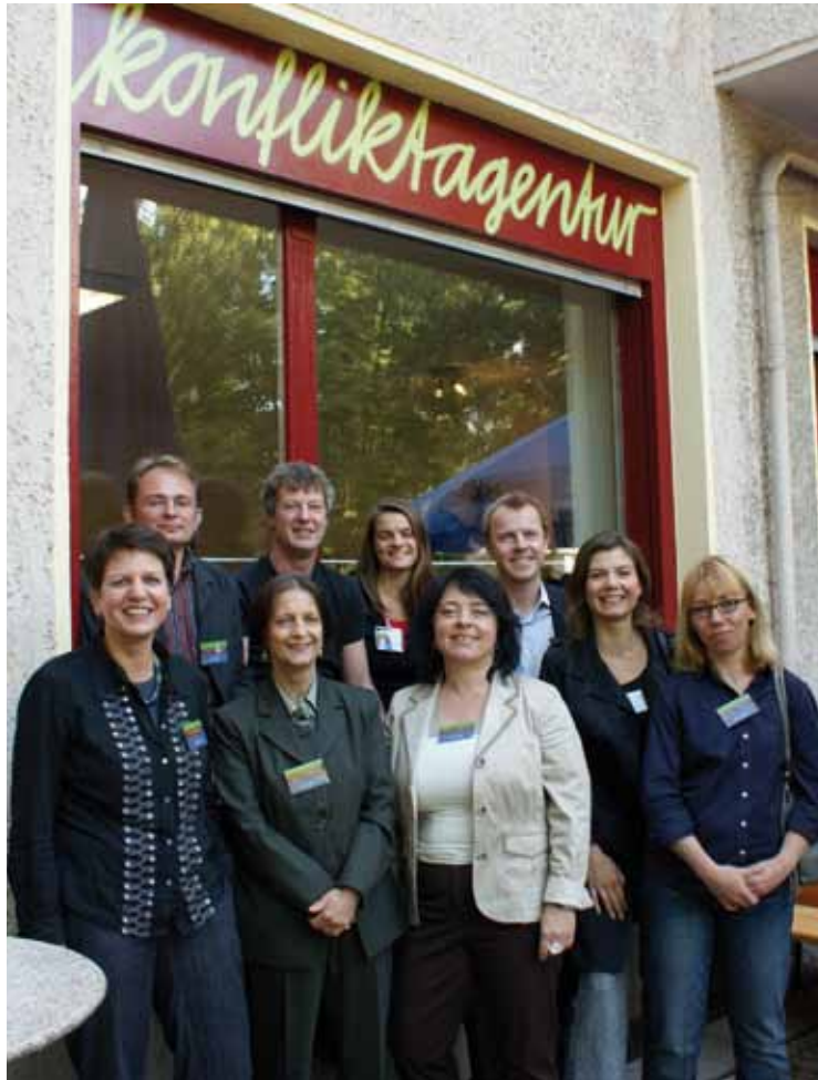
Die MediatorInnen der Konfliktagentur am Sparrplatz.

Mit Gedanken zum bevorstehenden Weihnachtsfest sollte sich meine eigentliche Schreibtätigkeit beschäftigen. Doch nach einiger Recherche und Ideen zum fröhlichen Fest kam ich auf die Idee, dass eben dieses erwähnte Fest als solches immer über Freundlichkeit, Zusammenkommen und ein friedliches Miteinander definiert wird. Durch weitere Überlegungen diese Gedanken mit Weihnachten und dem Kiez zu verbinden, stieß ich auf die am Sparrplatz ansässige Konfliktagentur. Deren Angebot fördert die Integration, Kooperation und nachhaltige soziale Stadtentwicklung. In Konflikt- und Streitfällen vermittelt die Agentur zwischen den streitenden Parteien. Konfliktsituationen werden begleitet und Hilfestellungen zur Erarbeitung eigener Lösungsstrategien gegeben. Insbesondere die Erfahrungen und Beratungen in den Bereichen Nachbarschaftsstreit, Familienkonflikt und interkulturelle Streitigkeiten kommen dabei den Betroffenen zugute. Sollten auch Sie, liebe Leser und Leserinnen, ein friedliches Weihnachtsfest in entspannter Atmosphäre wünschen, und wissen nicht, wie Sie Konflikte in Ihrem Umfeld lösen, so bietet sich ein