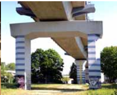
Kanal für die Abwasserdruckleitung am neuen Nordufer